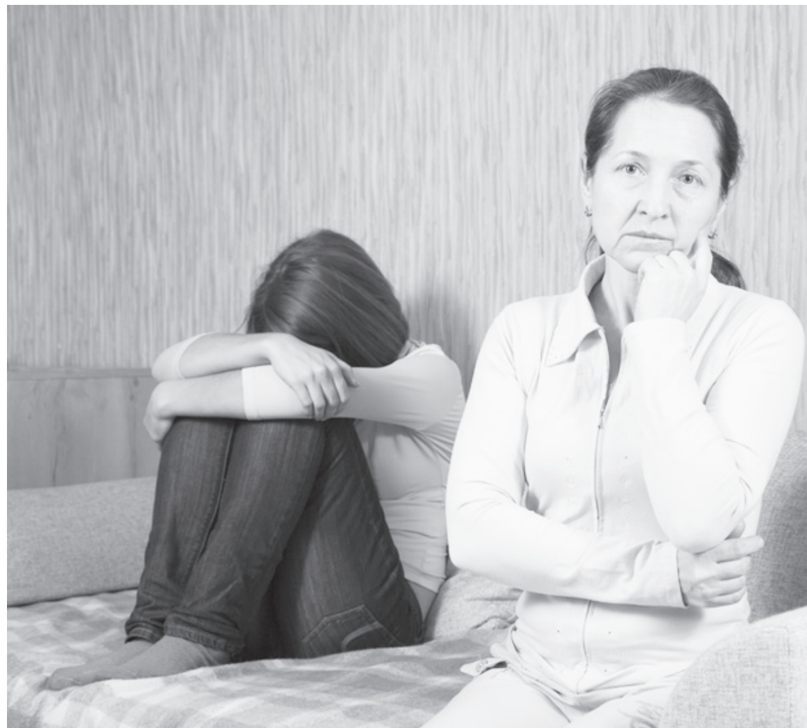
Нелегкий разговор с повзрослевшей дочерью.