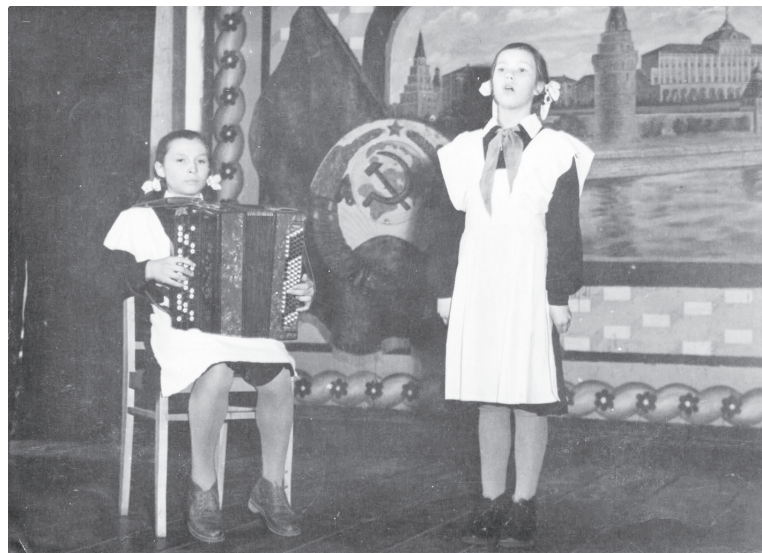
Районный смотр художественной самодеятельности, 1960 год.