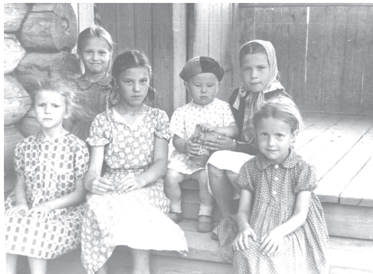
На крылечке своем...

не пускать, рядом была другая, чуть пониже, но нас тянуло на большую. По вечерам там было весело. Взрослые и молодежь с удовольствием катались с горки. Людей было столько, что легко и задавить могли.